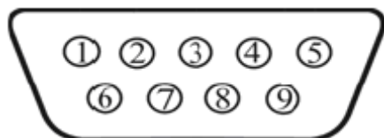
Схема разъёма для подключения к прибору КСК или компьютеру

7.4 Допускается работа дисплея с другими типами приборлов и ПО (требуется дополнительное согласование при заказе).