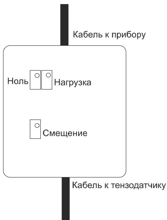
Рис2. Схематичное расположение потенциометров.

Схема расположения потенциометров под крышкой указана на рисунке 2.